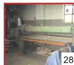
28 Bandschleifmaschine / Band Grinding Machine , Tisch / table 2450 x 1100 mm verfahrbar in Y, Bandbreite / grinding band width 150 mm , inkl. Schleifstaubabsaugung / exhaust