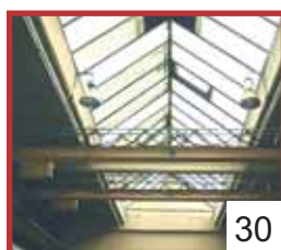
30 ·2 x Zweiträger- Brückenkran / double beam travelling crane STAHL , 16000 kg x 11000 mm ·2 x Zweiträger- Brückenkran / double beam travelling crane KAMO , 10000 kg ·ca. 15 Hallenkräne / cranes STAHL 500 - 5000 kg