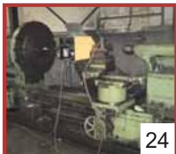
24 Leit- und Zugspindeldrehmaschine / Center Lathe HEYLIGENSTAEDT 1250 x 4000 Leit- und Zugspindeldrehmaschine / Center Lathe SCHAERER , Spitzenweite / max. turning length ca. 6000 mm